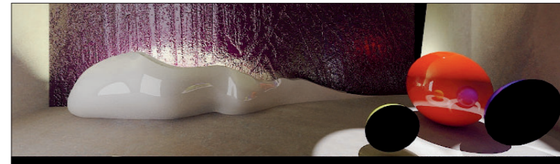
Una realizzazione di Ermanno Preti: la hall della Nuova Rid di Dello