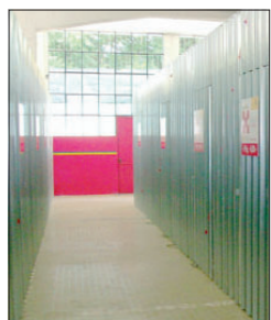
L'interno di self storage

Sono previsti anche servizi accessori: la copertura assicurativa, l'offerta di tutti i materiali per l'imballaggio (scatole, nastro, ecc), il servizio di carico e scarico con muletto, la disponibilità del fax e il servizio di segreteria per il cliente.