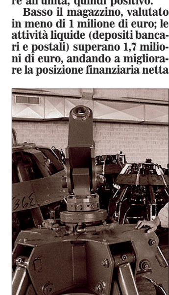
I «ragni» della Rozzi

Basso il magazzino, valutato in meno di 1 milione di euro; le attività liquide (depositi bancari e postali) superano 1,7 milioni di euro, andando a migliorare la posizione finanziaria netta